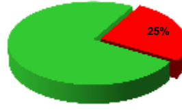
Neconformități ale sistemului de management